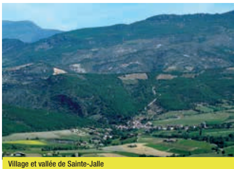
Village et vallée de Sainte-Jalle

petite route secondaire. S'offre alors à vous le discret col de la Croix dont vous ferez l'ascension en passant par Châteauneuf-de-Bordette. Vous redescendrez ensuite face en direction de la plaine de Vinsobres, abritant un vignoble réputé (AOP Vinsobres), avant d'obliquer vers Puyméras et Mérindol-les-Oliviers. Enfin, pour rejoindre Buis-les-Baronnies il vous est proposé d'aller découvrir la petite route montant à Propiac, magnifique mais qui demande d'en avoir encore un peu sous la pédale !