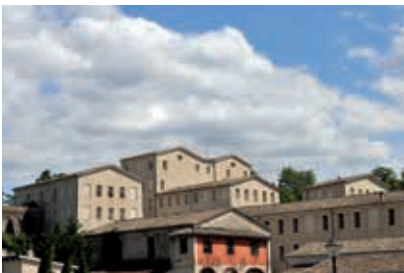
Ancienne papeterie Latune (Blacons)

Cette boucle par les deux rives de la Gervanne permet une balade tranquille sur le versant sud du Vercors. Elle traverse plusieurs villages chargés d'histoire. Tout le long de la montée en direction de Suze, le paysage s'ouvre sur les grandes falaises du Vercors : plateau du Vellan et gorges d'Omblyze. La biodiversité de la vallée y est remarquable, y compris au bord des routes. Au printemps notamment, sans quitter son vélo, il doit être possible d'identifier jusqu'à 20 espèces d'orchidées sauvages et 50 espèces de papillons de jour. À Beaufort, le vélo permet de visiter les ruelles du vieux village et de contempler un des plus beaux paysages de la Drôme depuis la place de la Fontaine qui domine la Gervanne à l'est du village. La sortie de Beaufort vers Blacons offre une belle descente en direction du terrain de sport du village. Ici la petite route à gauche donne un accès à la Source des Fontaigneux, qui est la principale résurgence « vauclusienne » du massif karstique de la haute vallée. En été, le débit de cette source est supérieur à celui de la Gervanne elle-même. Le long de la route qui descend de Beaufort, au niveau de Montclar-sur-Gervanne, la vue sur la forêt de Saoû et des Trois-Becs est magnifique.