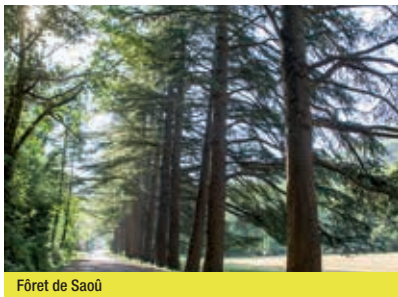
Forêt de Saoû

en passant par la vallée de la Grenette. Entre Crest et Valence, après un nouveau passage par la Gare des Ramières (Allex) vous achèverez votre parcours par de petites routes tranquilles entre Upie et Montéléger. Une véloroute aménagée depuis le parc départemental de Lorient vous conduira jusqu'au centre de Valence.