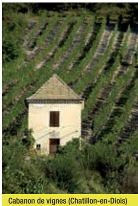
Cabanon de vignes (Châtillon-en-Diois)

Un circuit pétillant comme la Clairette qui fait la renommée de Die et de la région. Le climat du Pays Diois, entre fraîcheur du Vercors et ensoleillement généreux de la Provence, est idéal pour le raisin et... le cycliste. Cette boucle progressive, vous emmène au cœur des petites parcelles, parmi les plus hautes de France, qui s'étalent à flanc de coteaux entre 300 et 700 mètres d'altitude, au pied des impressionnantes falaises du Glandasse. Au musée d'histoire et d'archéologie de Die, ou sur le parcours d'interprétation de la Cave Jaillance, découvrez la légende de la naissance de la Clairette de Die. Puis, prenez la « route de la Clairette » pour découvrir son vignoble. À Saint-Roman, faites halte dans l'une des deux caves du village et poursuivez en direction de Châtillon-en-Diois. Les cépages gamay, syrah, pinot noir, aligoté et chardonnay y produisent des vins rouges, rosés et blancs « AOC Châtillon-en-Diois ». La cave du domaine de Maupas mérite une pause pour le cadre exceptionnel qu'elle offre : bâtiment en pierres, vignoble parsemé de cabanons, Glandasse en toile de fond. Si le cœur vous en dit, faites un petit détour pour découvrir le charme du village médiéval et botanique de Châtillon-en-Diois. Un parcours de découverte du patrimoine vous permettra d'en savoir plus