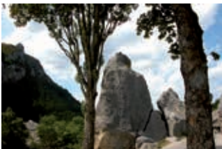
Le Claps (Luc-en-Diois)

Ce circuit remonte la dernière rivière sauvage d'Europe, se plaçant naturellement sous le signe de l'eau et du ressourcement. Cette boucle de moyenne montagne avec ses 3 cols de basse altitude, déjà sous le soleil de Provence, est idéale pour une mise en jambe de début de saison. Départ au cœur du chaos rocheux du Claps de Luc, résultant du spectaculaire éboulement du Pic de Luc dans la rivière Drôme (baignade, escalade, via ferrata). Longez le Marais des Boulignons, unique dans son contexte de montagne, et dont la richesse écologique résulte de la juxtaposition des versants secs et des zones humides, ce qui permet l'observation d'espèces rares comme la Demoiselle vierge ou la Grenouille rieuse... Arrivés au village