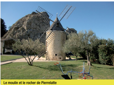
Le moulin et le rocher de Pierrelatte

d'eau vers l'est sur l'île des Dames. Emprunter le parcours sportif vers le nord et rejoindre le Rhône. Poursuivre vers le nord (ViaRhôna) jusqu'au barrage. Prendre la D93 sur le barrage. Après 500 m prendre à droite le chemin des Margerieries. Après 600 m tourner à droite, puis après 300 m prendre à gauche à 90° vers le sud. Direction Pierrelatte, chemin des Margerieries, qui devient ensuite le chemin du Pont de Rome. Prendre à droite chemin de Bel, puis du Méas. Prendre à droite le chemin de Font Reynaud, puis au carrefour avec la rue Notre Dame, prendre chemin de Sérignan. Rejoindre la D13 route de Pierrelatte à Bourg-Saint-Andéol dans le rond-point. Prendre à gauche et entrer dans Pierrelatte par l'avenue Maréchal Juin en passant sous la N7. Au carrefour, après le lavoir, tourner à droite sur le boulevard Chandeysson, et revenir sur la place du Champ de Mars.