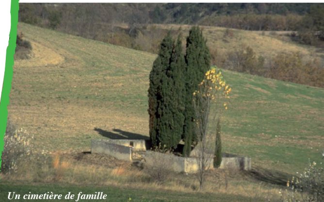
Un cimetière de famille