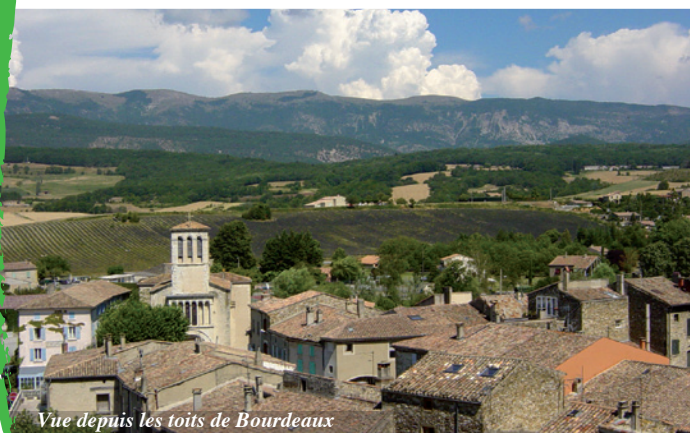
Vue depuis les toits de Bourdeaux