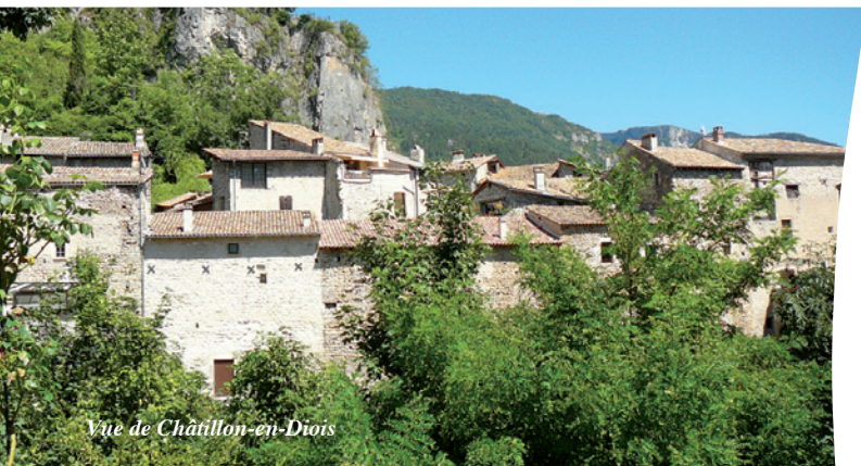
Vue de Châtillon-en-Diois

Les itinéraires de randonnée pédestre connus sous le nom de GR® et GR® de Pays, jalonnés de marques blanc-rouge et/ou jaune-rouge, sont une création de la FFRandonnée. Ils sont protégés au titre du code de la propriété intellectuelle. Les marques utilisées sont déposées à l'INPI. Nul ne peut en disposer sans une autorisation expresse. Sentier de Grande Randonnée et Grande Randonnée de Pays sont des marques déposées, ainsi que les marques de couleur blanc-rouge et jaune-rouge.