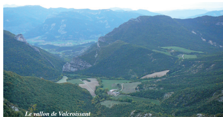
Le vallon de Valcroissant

Les visites sont organisées, en lien avec l'Office du tourisme de Die auprès duquel il faut s'adresser.