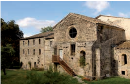
Abbaye de Valcroissant - Propriété privée (Die)

Découvrez le Pays Diois par les 5 sens, sur cette boucle tranquille à la rencontre de l'art de vivre de ce territoire lové au pied des falaises du Vercors. Ici, les paysages grandioses incitent à l'épanouissement et influencent les habitants qui vivent au plus proche de la nature. La clémence du climat favorise une production locale variée, respectueuse de son environnement et des pratiques de développement. Au départ de Die, visitez la Savonnerie de la Drôme, puis sur la route, retrouvez les bouquets de senteurs entre pins et lavande. À Molières-Glandaz, au pied de l'imposante montagne qui donne son nom