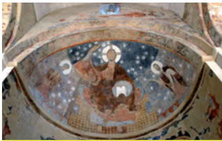
Peinture murales du 12 e siècle (Église de Saint-Marcel-lès-Sauzet)

Le départ de cette boucle tout en paysages et en patrimoines se fait de Marsanne les moins sportifs auront la possibilité de louer, auprès de l'office de tourisme, des vélos à assistance électrique. Cette balade vous entraînera de village en village, pour la plupart « perchés », dans un paysage vallonné encerclant la riche plaine de la Valdaine. Avant de prendre la descente, un petit aller-retour jusqu'à la table d'orientation (route de Mirmande), au-dessus du vieux village de Marsanne, s'impose. Un vaste paysage tout en couleurs s'ouvrira à vous et vous donnera une vue d'ensemble de votre circuit. Vous descendrez ensuite à flanc de colline, en profitant pleinement de chaque panorama, pour rejoindre le Roubion, remonter sur le flanc est et contourner la plaine côté sud. Petite incursion dans la plaine afin d'admirer les villages perchés sur les buttes et profiter de leur riche patrimoine historique. C'est par de petites routes tranquilles bordées de bois ou de cultures que vous remonterez tranquillement jusqu'au départ de la boucle.