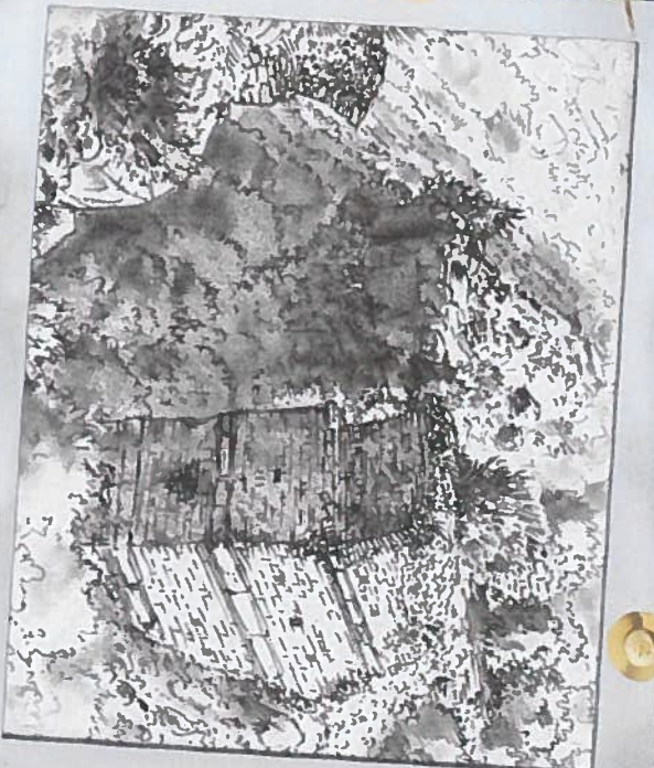
La pile du pont romain