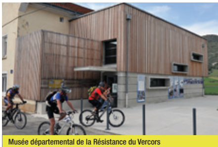
Musée départemental de la Résistance du Vercors

de goûter aux grands paysages. On pourra faire une halte à la Fontaine du Lauzet et son refuge. Après une descente, le circuit conduit au musée de la Préhistoire où une visite permet de porter un autre regard sur ce territoire. C'est enfin sans difficulté que l'on regagne le village de Vassieux-en-Vercors.