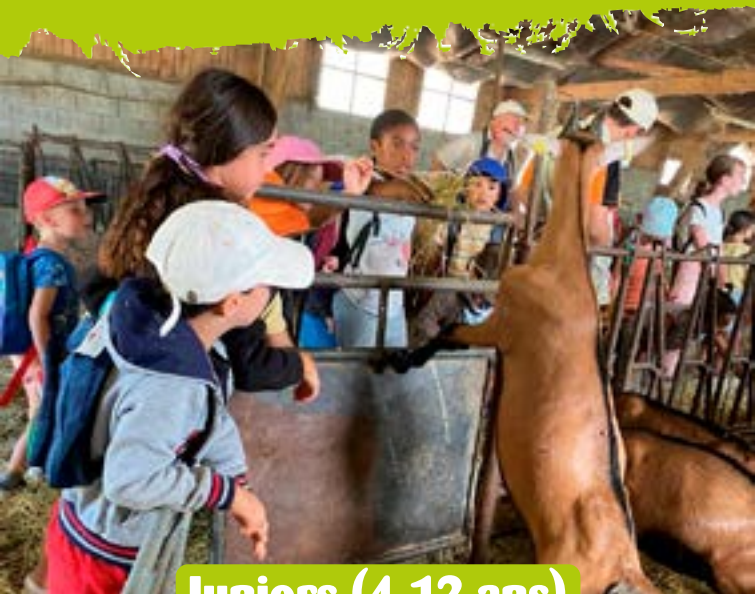
Juniors (4-12 ans)

100% Fun est le séjour en multi activités. Regroupés par tranche d'âge, les enfants s'amuse et vivent des vacances dynamiques et variées, étonnantes et drôles !