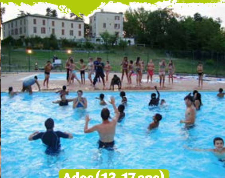
Ados (13-17 ans)