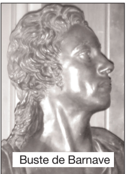
Buste de Barnave