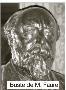
Buste de M. Faure

"Un grand nombre de français ignorent presque totalement ce qui a trait à la géographie et à l'histoire de la commune où ils sont nés. Il y aurait cependant avantage à ce que tous connaissent bien la physionomie de la terre natale, ses ressources, la coutume, la langue de ses habitants, leurs traditions, contes, proverbes, le rôle qu'elle a joué dans le passé, les citoyens éminents qu'elle a enfantés..."