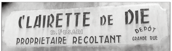
Enseigne d'un ancien producteur de "Clairette".