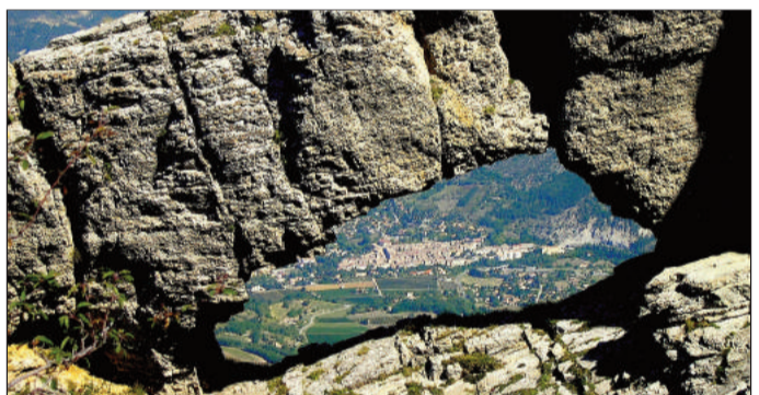
Vue unique du village de Saillans au travers le trou du rocher de "La Laveuse".