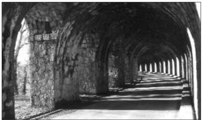
Jeux d'ombres et de lumières dans le tunnel.