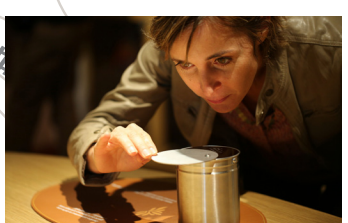
Cité du Chocolat Valrhona Tain l'Hermitage