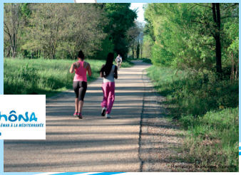
ViaRhôna - Vélo route Voie verte