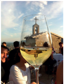
3 Chapelle St-Christophe à Tain l'Hermitage