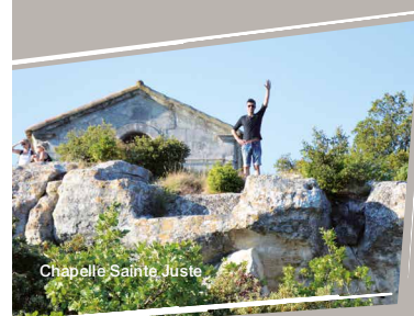
Chapelle Sainte Juste