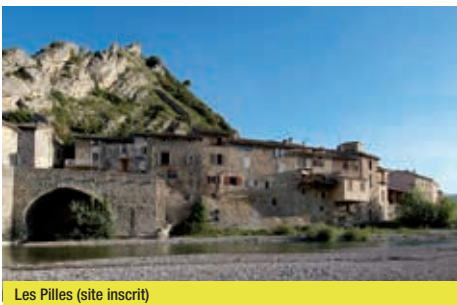
Les Pilles (site inscrit)

vous déboucherez au petit village de Saint-Ferréol-Trente-Pas. Pour finir votre tour, vous prendrez alors la route qui longe le Bentrix jusqu'à son point de confluence avec l'Eygues, à deux tours de roues de votre point de départ.