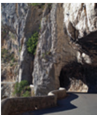
Les Barraques-Grand Goulets

Le Vercors, cette citadelle inaccessible, s'est doté au 19 e siècle de routes pour venir s'ouvrir au reste du monde. Ces routes reprennent tout le caractère du massif qu'elles sillonnent par leurs aspects spectaculaires et audacieux ; leurs tracés offrent des panoramas exceptionnels qui en ont fait leur réputation. Ces routes sont un réel défi pour les cyclos à l'image de ce parcours vertigineux.