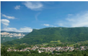
Saint-Jean-en-Royans au pied de l'Écharasson

Au départ de St Jean en Royans, cette boucle est un ravissement pour les cyclos qui souhaitent autant se faire plaisir dans de hauts lieux que d'augmenter leur liste de cols parcourus, c'est en effet pas moins de six cols proposés par des routes incontournables du Royans-Vercors ! Au départ de Saint-Jean, on prend la direction de Bouvante pour s'échauffer sur une pente douce pour atteindre le premier col du jour celui de la Croix. La montée se poursuit dans un décor plus minéral, au col du Pionnier c'est une ambiance forestière typique du massif. On prolonge l'effort sur une pente douce vers les cols de la Portette et de Taillebourse qui mettent fin aux 18 km et plus de 900 m d'ascension.