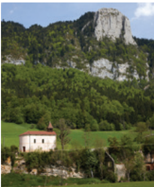
Saint-Agnan-en-Vercors chapelle de la Britière

Patrimoine d'exception, classé Parc naturel régional depuis 1970, le cœur de Vercors ne ressemble à aucun autre territoire : une nature sublime, une richesse exceptionnelle tant au niveau de ses reliefs que de sa faune, de sa flore, de son patrimoine bâti ou de son histoire en font un espace unique à découvrir à vélo.