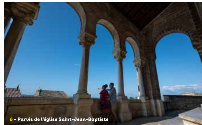
6 - Parvis de l'église Saint-Jean-Baptiste