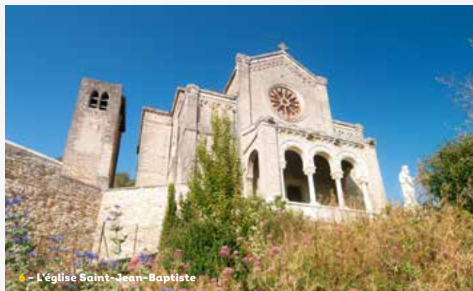
6 - L'église Saint-Jean-Baptiste

Ne pas jeter sur la voie publique / Impression : Impressions Modernes