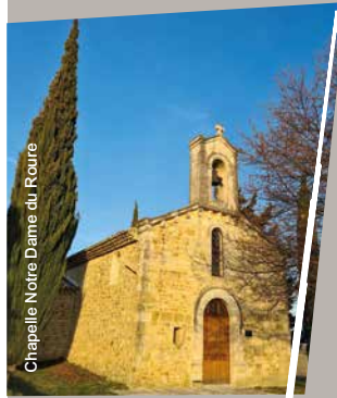
Chapelle Notre Dame du Roure