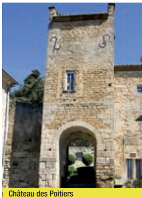
Château des Poitiers

Cette boucle tranquille, destinée à un public familial est située dans la vallée du Rhône et la basse vallée de la Drôme. Elle traverse quatre villages perchés et rejoint la confluence de la rivière Drôme et du Rhône. Depuis la passerelle cyclable de Printegarde, située le long de la ViaRhôna, la vue panoramique sur la rivière Drôme et les contreforts du Vivarais est remarquable. Il est possible, ensuite, depuis cette passerelle franchissant la Drôme, de remonter la rivière en direction de Livron-sur-Drôme et d'Allex. Les principales difficultés de cette boucle sont les courtes ascensions dans les villages perchés d'Allex (Montée de l'Ancien Hôpital), d'Étoile, et de Livron. L'ascension du vieux Livron permet de profiter d'une vue magnifique sur la vallée de la Drôme et la forêt de Saou depuis le belvédère de l'ancienne place du marché (sud du village). Arrivé à Allex, nous vous recommandons de faire un petit détour à la Gare des Ramières (au niveau du pont sur la Drôme), route de Grâne. Ce lieu présente la réserve naturelle nationale des Ramières et la rivière Drôme. À partir de la plaine d'Étoile-sur-Rhône, faite cap sur le sud par l'itinéraire bis de la ViaRhôna en direction de la Voulte-sur-Rhône.