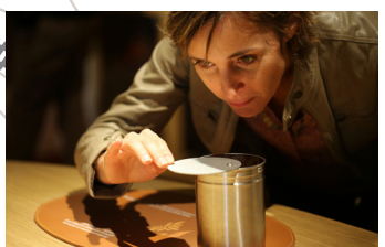
Chocoladecentrum Valrhona Tain-l'Hermitage