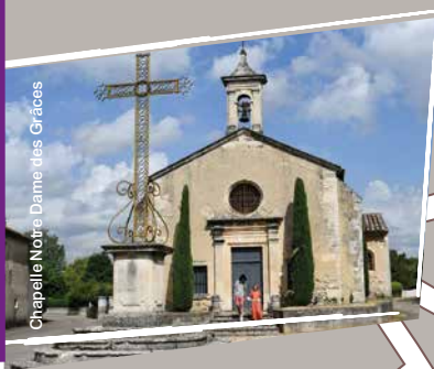
Chapelle Notre Dame des Grâces