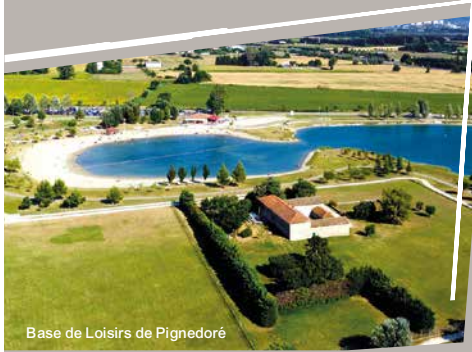
Base de Loisirs de Pignedoré

Aire de jeux Lavoir Base de Loisirs de Pignedoré